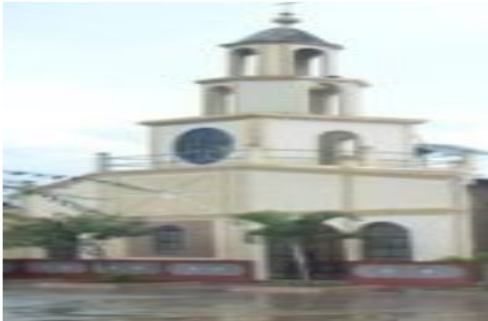
Figura 27 Iglesia de San Luis Grande, registro fotográfico: 02-11-2014