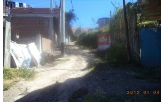
Figura 38 Sexto descanso del Señor de los Milagros, registro fotográfico: 31-07-2014