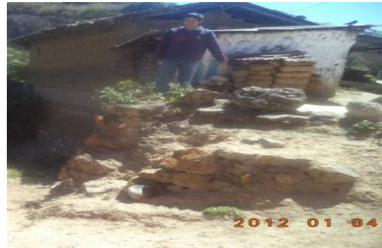
Figura 34 Cuarto descanso del Señor de los Milagros en San Gal, registro fotográfico: 31-07-2014