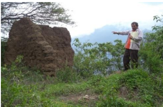
Figura 19 Tercera escuela, registro fotográfico: 15-03-2014