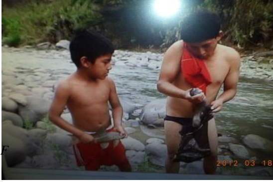
Figura 60 Ttilapias y lífes en el río de Las Paltas, registro fotográfico: 05-05-2014