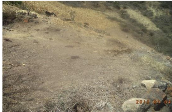
Figura 32 Tercer descanso del Señor de los Milagros en Paty Cruz, registro fotográfico: 31-07-2014