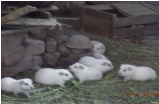
Figura 57 Crianza de cuyes. registro fotográfico: 01-01-2015 2015