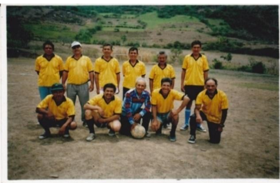
Figura 17 Deportistas veteranos en la fiesta de San Martín de Porras, 27-11-2001.