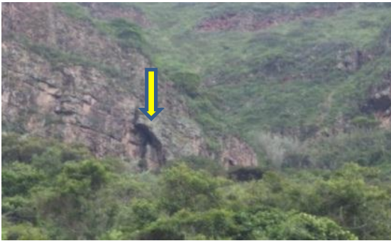
Figura 03 Padre Rumi (Padre de piedra), registro fotográfico: 15-03-2014