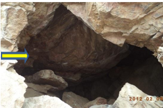
Figura 05 La Campana, registro fotográfico: 09-10-2014