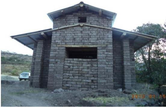
Figura 66 La Capilla en Cúñish registro fotográfico: 24-08-2014