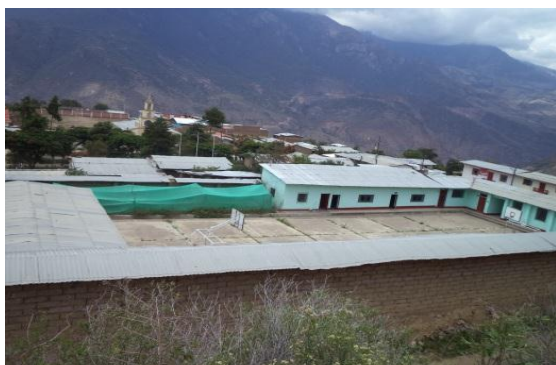
Figura 21 Panorama Interior de la IE. N° 82264 de San Luis Grande, registro fotográfico: 15-03-2014