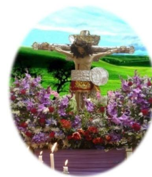
Figura 42 Imagen del “Señor de los Milagros” en San Pablo, registro fotográfico: 14-09-2013