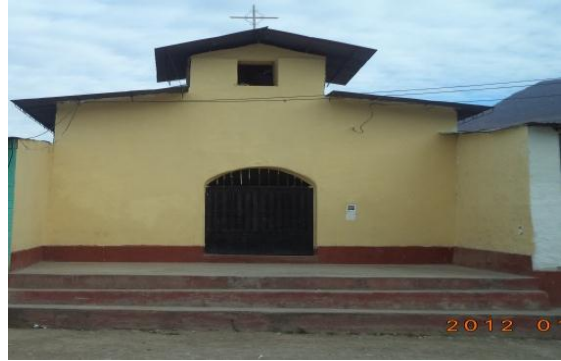
Figura 26 Capilla de Pampa de San Luis, registro fotográfico: 31-07-2014