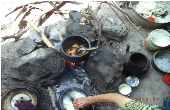
Figura 55 Preparación de la gallina guisada registro fotográfico: 15-04-2013