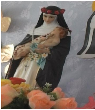
Figura 74 Santa Rosa de Lima Patrona del caserío Las Paltas, registro fotográfico: 30-08-2014