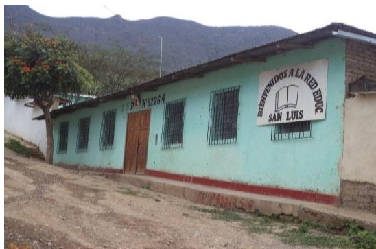
Figura 20 Exterior de la IE. N° 82264 de San Luis Grande; registro fotográfico: 15-03-2014