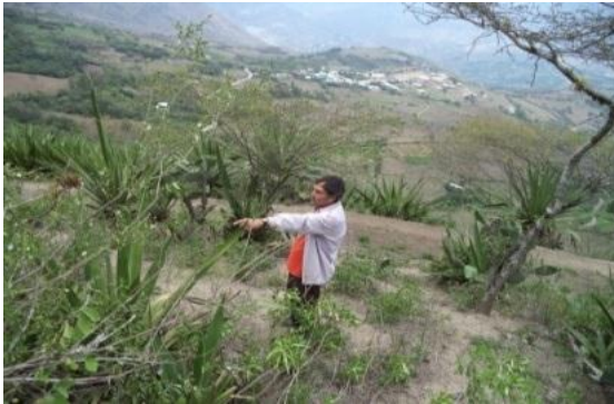
Figura 31 Segundo descanso del Señor de los Milagros, registro fotográfico: 31-07-2014