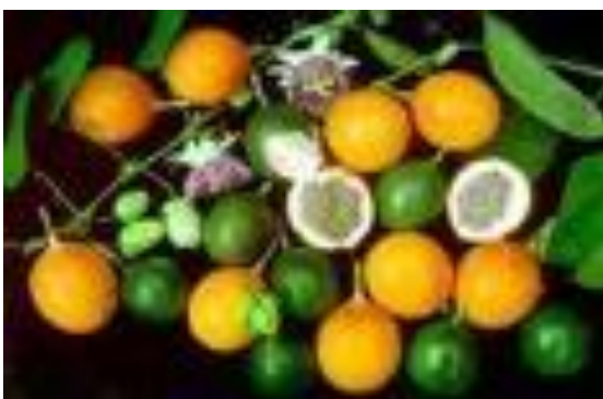
Figura 53 Granadilla, registro fotográfico: 15-04-2013