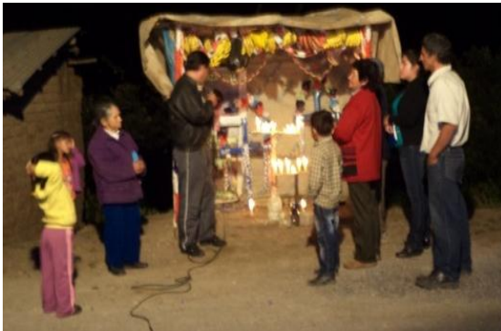
Figura 33 Cruz Traslada a Pampa de San Luis, registro fotográfico: 01-05-2013