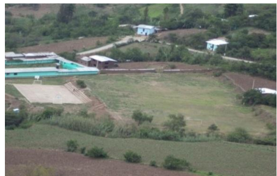
Figura 18 Campo y plataforma deportiva de San Luis, registro fotográfico: 15-03-2014