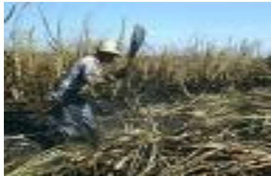
Figura 52 Chacra de caña de azúcar, registro fotográfico: 15-03-2013