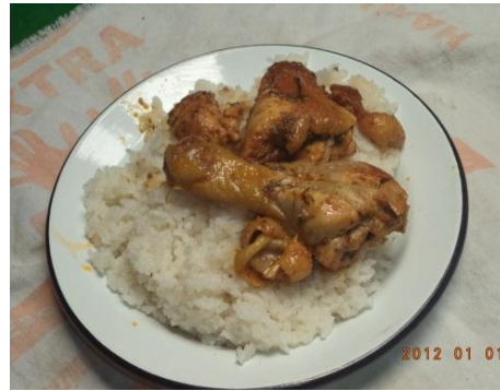
Figura 56: Plato típico con gallina guisada registro fotográfico: 15-04-2013