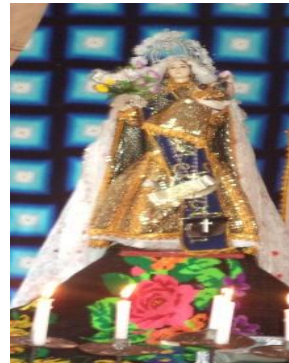
Figura 69 Virgen del Rosario, o Ingolita, registro fotográfico: 12-10-2014