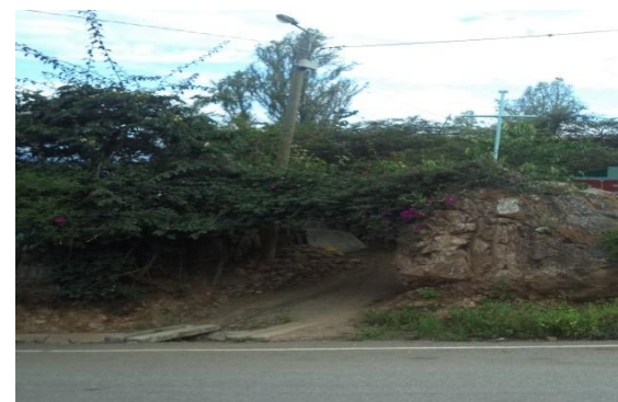
Figura 40 Lugar por donde pasó El Señor de los Milagros por el Pueblo Nuevo de San Bernardino, registro fotográfico: 26-05-2014