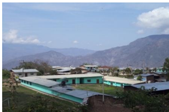
Figura 22 Escuela actual de Pampa de San Luis, registro fotográfico: 15-03-2014