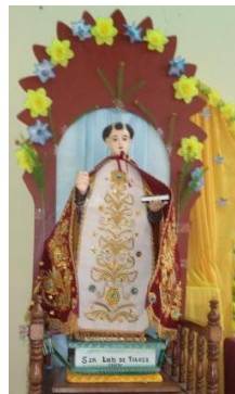
Figura 28 Patrón San Luis de Tolosa, registro fotográfico: 02-11-2014