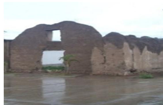
Figura 06 Iglesia de San Luis Grande, registro fotográfico: 15-03-2014