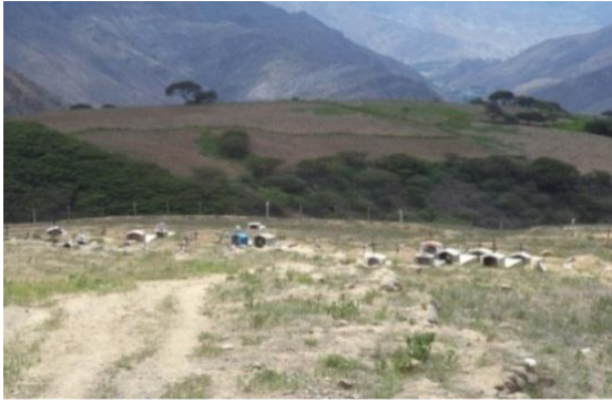
Figura 13 Cementerio de San Luis Grande, registro fotográfico: 15-03-2014