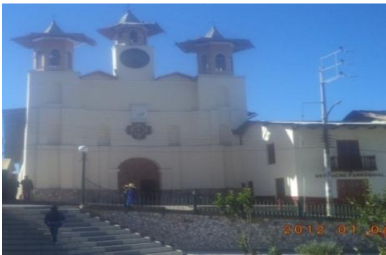
Figura 39 Séptimo descanso del Señor de los Milagros en la iglesia Matriz de San Pablo, registro fotográfico: 05-05-2014