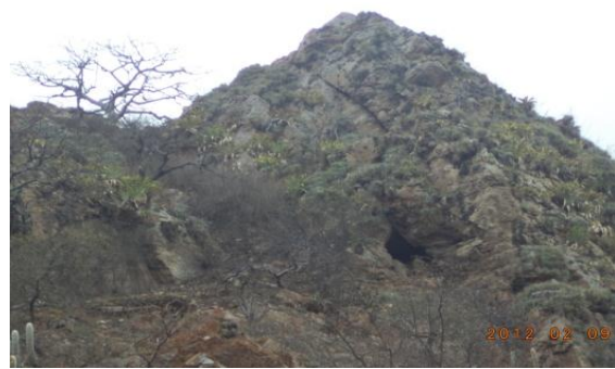
Figura 04 Peña de la Campana, registro fotográfico: 09-10-2014