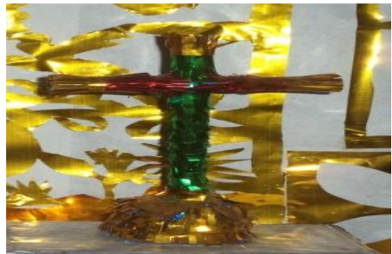
Figura 65 Cruz de Motupe en Cúñish, registro fotográfico: 08-08-2014