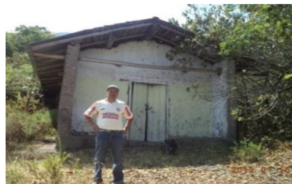
Figura 71 Capilla El Rosario en el Carriso registro fotográfico 24-08-2014