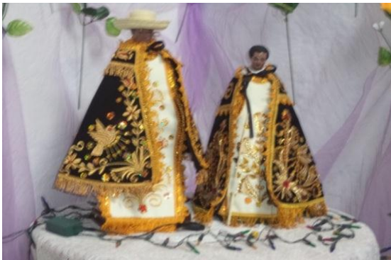
Figura 62 Patrones "San Martín de Porras" de Pampa de San Luis, registro fotográfico: 30-11-2013