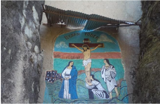
Figura 37 El Cristo dibujada en el cerro, registro fotográfico: 31-07-2014