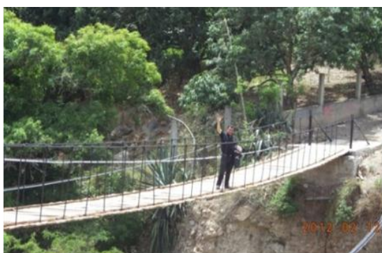
Figura 23 Puente colgante de Las Paltas, registro fotográfico: 15-03-2014