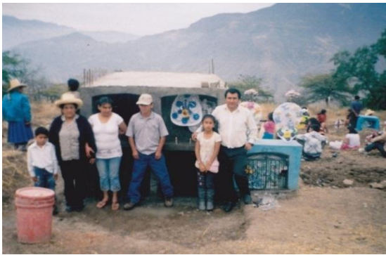
Figura 15 Cementerio de Pampa de San Luis, registro fotográfico: 31-10-2010