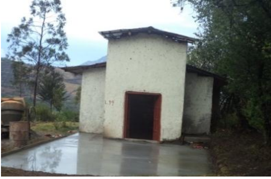
Figura 72 Capilla actual en el fundo El Carriso registro fotográfico 09-10-2014