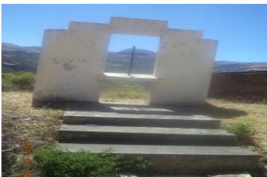
Figura 35 Cruz Traslada al nuevo pueblo de San Gal, registro fotográfico: 31-07-2014