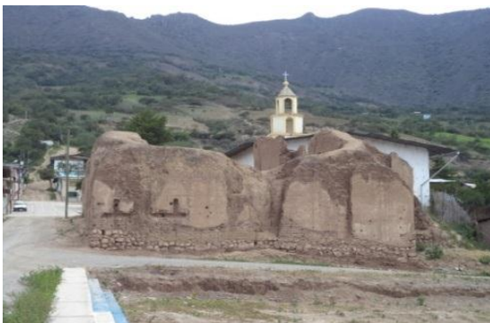
Figura 11 posterior de la Iglesia de San Luis Grande, registro fotográfico: 15-03-2014