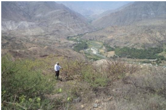
Figura 09 Panoramas de Las Trincheras, Las Paltas y LLallán; registro fotográfico: 13-07-2014