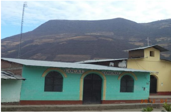
Figura 25 Casa Comunal en Pampa de San Luis, registro fotográfico: 31-07-2014