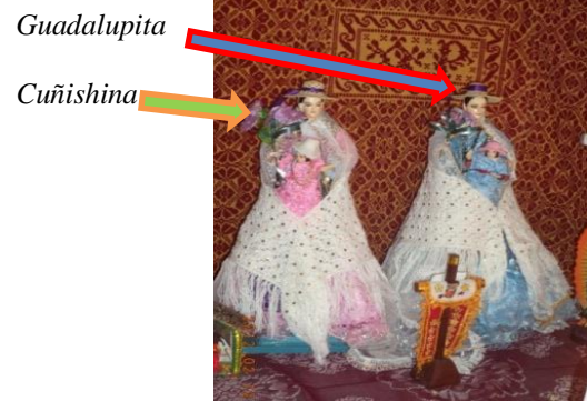
Figura 67 Virgen del Rosario o Cuñishina y la Guadalupe, registro fotográfico: 12-10-2014