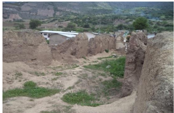
Figura 10 Interior de la Iglesia de San Luis Grande, registro fotográfico: 15-03-2014