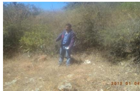
Figura 36 Quinto descanso del Señor de los Milagros, cerca de la Peña "El Cristo" registro fotográfico: 31-07-2014