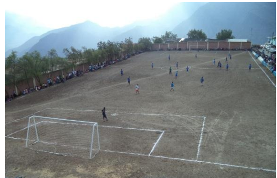
Figura 16 Campo deportivo de San Luis Grande, registro fotográfico: 02-11-2014