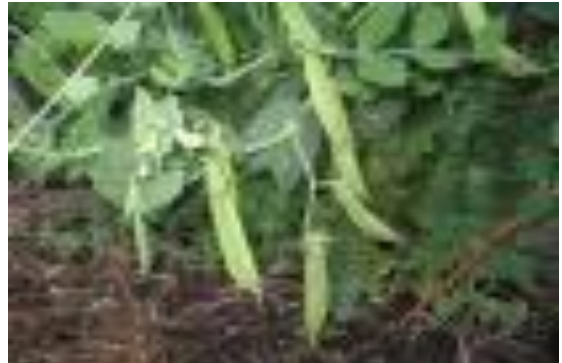
Figura 46 Plantas de arveja, registro fotográfico: 05-05-2013