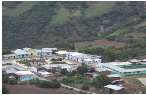
Figura 61 Pueblo del caserío Pampa de San Luis. registro fotográfico: 30-11-2013