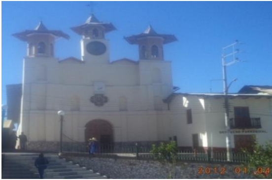
Figura 07 Iglesia Matriz de San Pablo, registro fotográfico: 15-03-2014