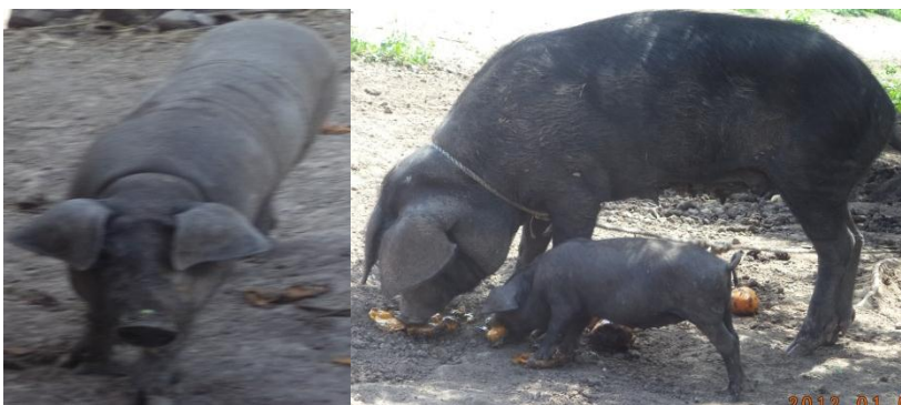
Figura 59 Crianza de cerdos, registro fotográfico: 02-02-2014