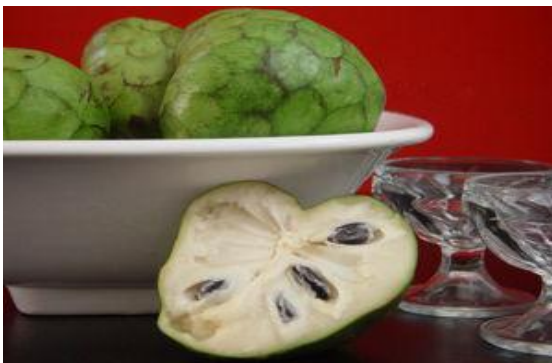
Figura 51 Chirimoya madura partida registro fotográfico: 15-03-2013