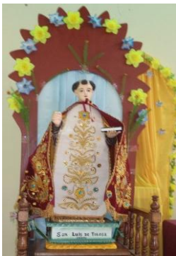
Figura 64 Patrón San Luis de Tolosa, de San Luis Grande, registro fotográfico: 30-11-2013