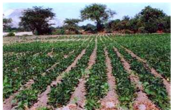
Figura 48 Chacra de frijol, registro fotográfico: 24-07-2013