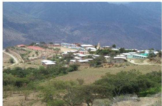
Figura 63 Pueblo de San Luis Grande, registro fotográfico: 30-11-2013