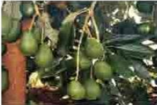
Figura 49 Producción de palta, registro fotográfico: 24-07-2013