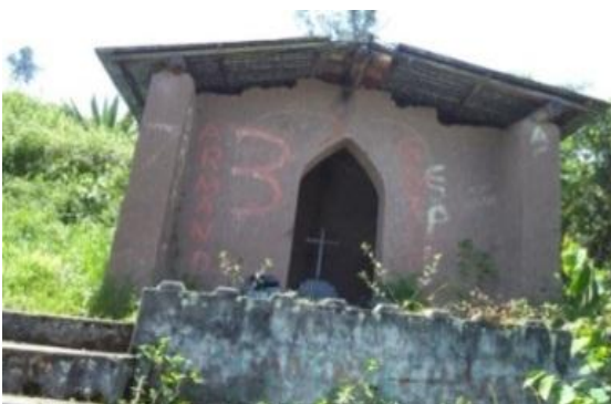
Figura 41 Lugar por donde pasó El Señor de los Milagros sobre la peña de Cadacchón,