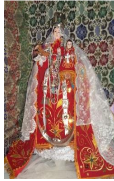
Figura 73 La Patrona Virgen del Rosario, registro fotográfico 12-10-2014