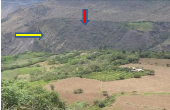
Figura 02 Cerro Ayaloma y la Huaca, registro fotográfico: 15-03-2014