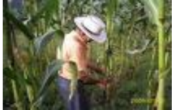
Figura 44 Plantas de maíz amarillo duro, registro fotográfico: 05-05-2013