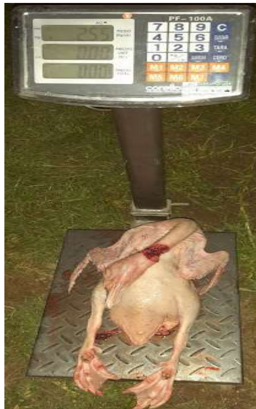
Foto 9. Control del peso de la carcasa