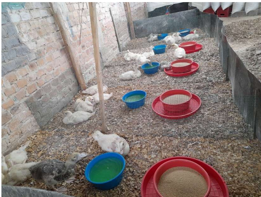
Foto 1. Muestra la distribución de los patos por cada corral (una repetición), cada corral con cuatro patos.