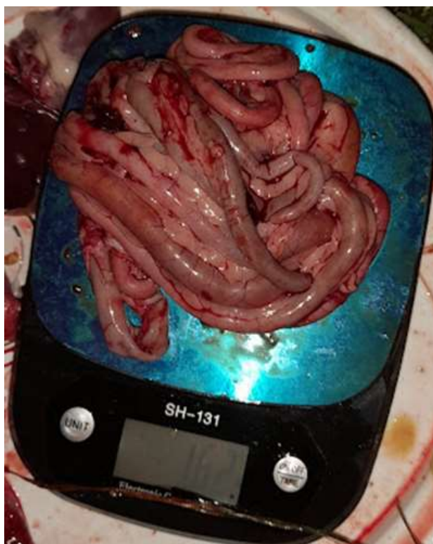
Foto 12. Pesado de los intestinos