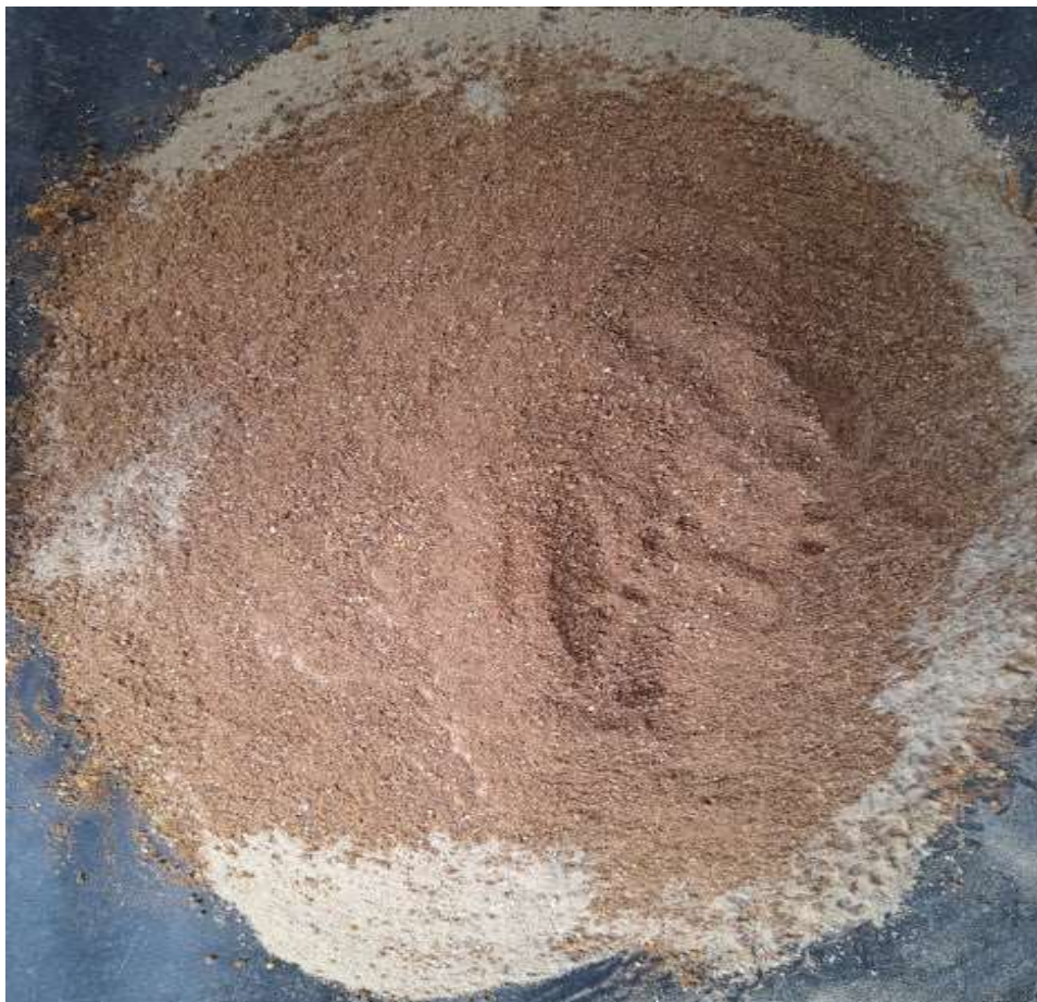
Foto 7. Mezclado de los ingredientes alimenticios