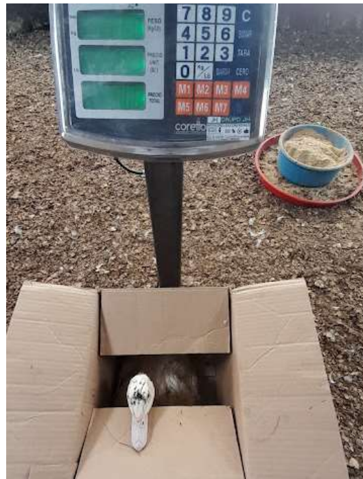
Foto 8. Control de pesos del pato vivo.