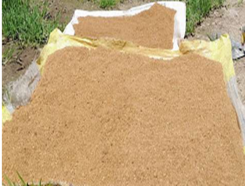
Foto 6. Harina de residuos de mango, obtenido luego del proceso de molienda