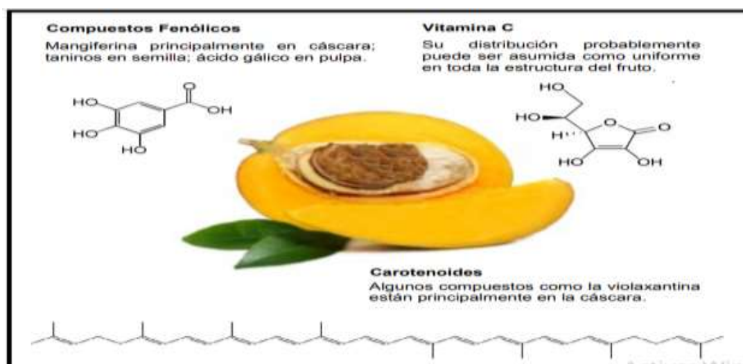
Figura 1. Distribución de compuestos antioxidantes en el fruto de mango (Ayala-Zavala et al., 2010)

Las semillas de mango tienen una cubierta fibrosa y dura, que contiene un grano rico en aceite (6-16% de la MS) y almidón (40-50%). Si bien las semillas son voluminosas y con un alto contenido de fibra (más del 20%), las semillas pueden considerarse como un valioso recurso energético, aunque bajo en proteínas (menos del 10% de MS). Además, las semillas de mango aportan gran cantidad de minerales como magnesio, potasio, fósforo, calcio y sodio. La semilla no presenta efectos tóxicos, sin embargo, contiene algunos factores antinutricionales como oxalatos y taninos. La cáscara es rica en fibra y pigmentantes naturales. Ambos residuos deben secarse para evitar rancidez y deterioro de los componentes nutricionales y contaminación microbiológica (Ribeiro et al., 2008).