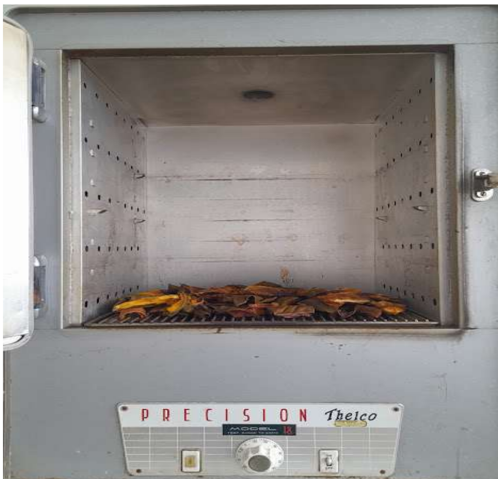
Foto 5. Detalles de la estufa en que fueron desecados los residuos del fruto de mango