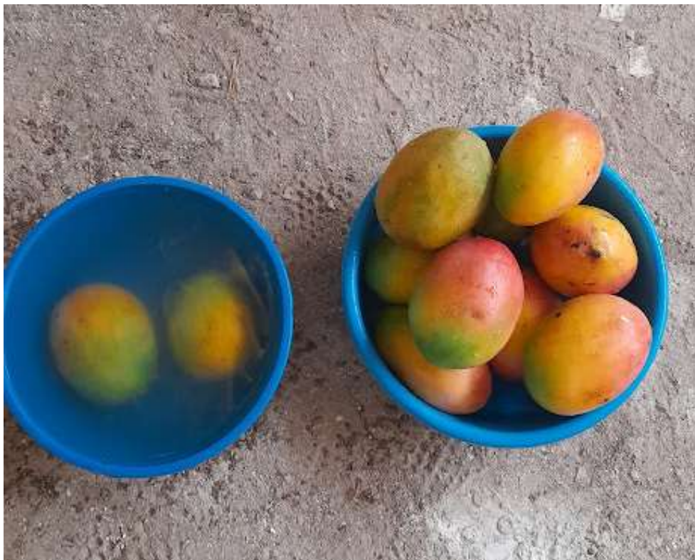
Foto 3. Lavado del mango fresco