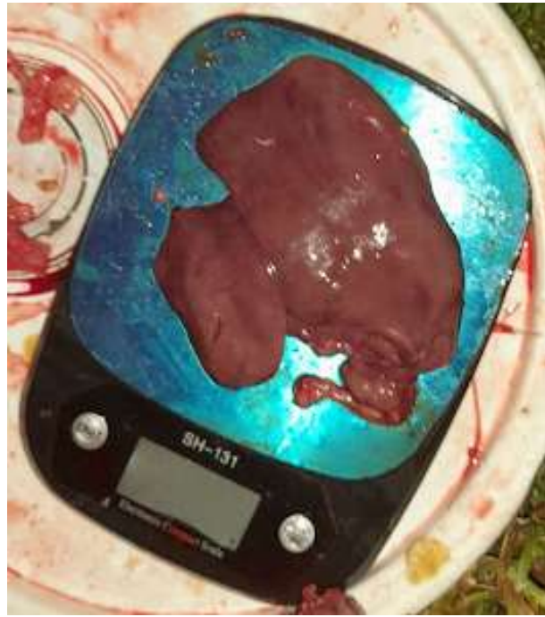
Foto 10. Pesado del hígado