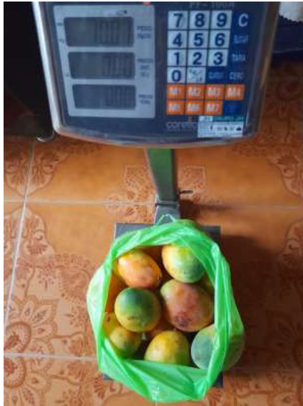
Foto 2. Mango fresco de la variedad Edward.