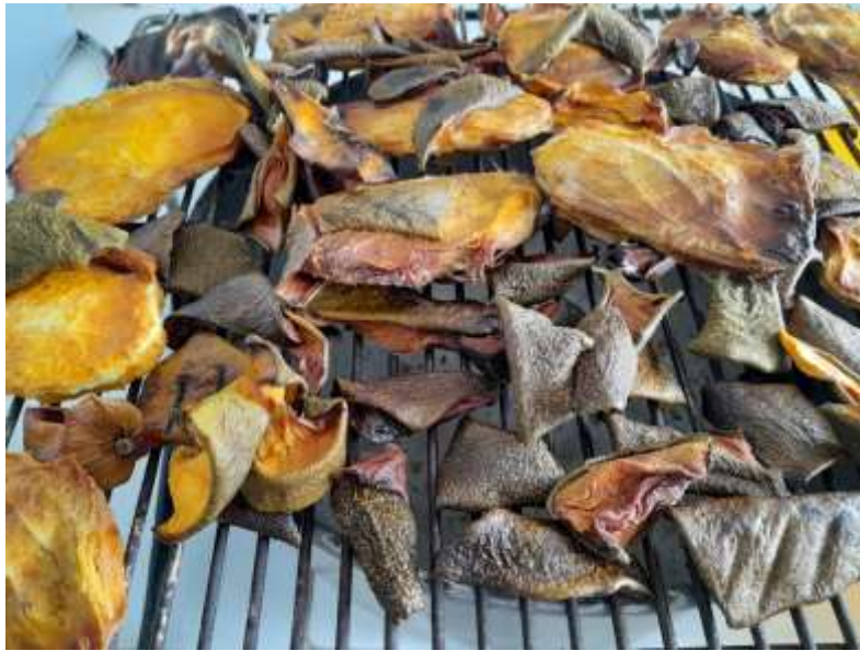
Foto 4. Residuos de mango en proceso de desecación