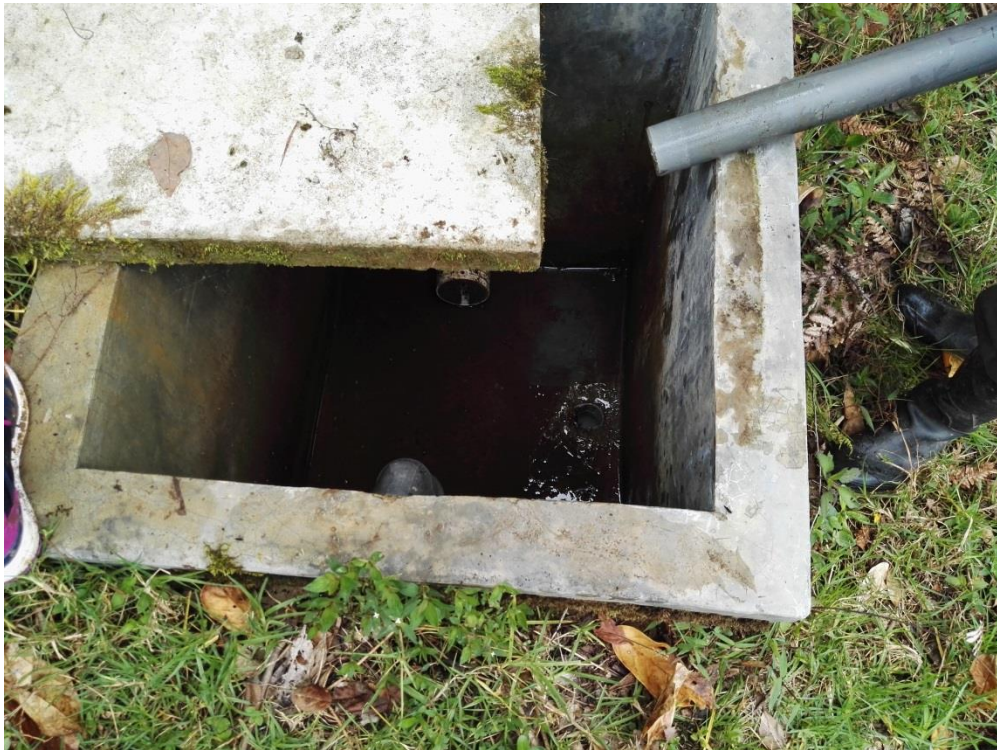
Foto N° 04: Vegetación y tierra que con el tiempo se han acumulado hasta el borde de la cámara, debido a las lluvias.