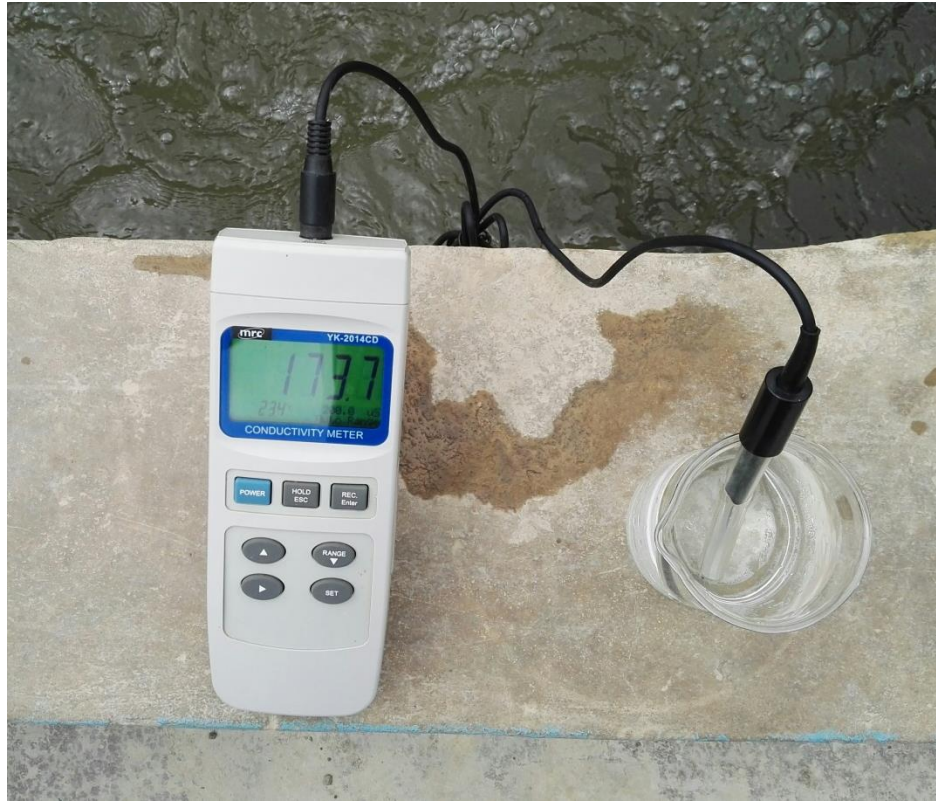
Foto N°: 07: Se hizo la prueba de conductividad eléctrica del agua.