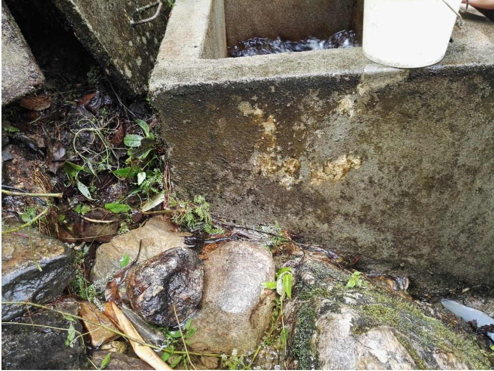
Foto N° 03: Se aprecia filtración por las paredes de la estructura de la captación y que pone en riesgo las cajas de filtro.