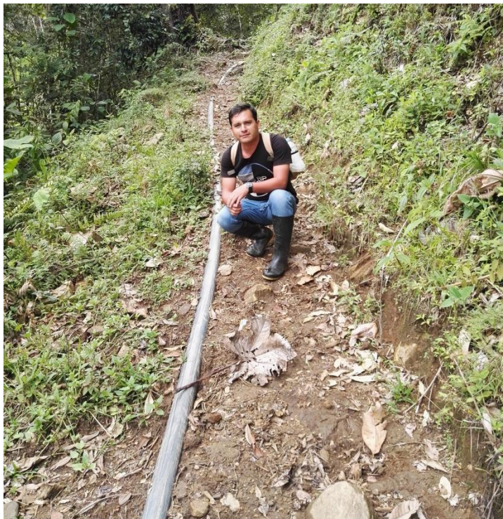
Foto N° 05: Tubería expuesta a cualquier tipo de rotura ya que se encuentra paralela al camino de herradura.