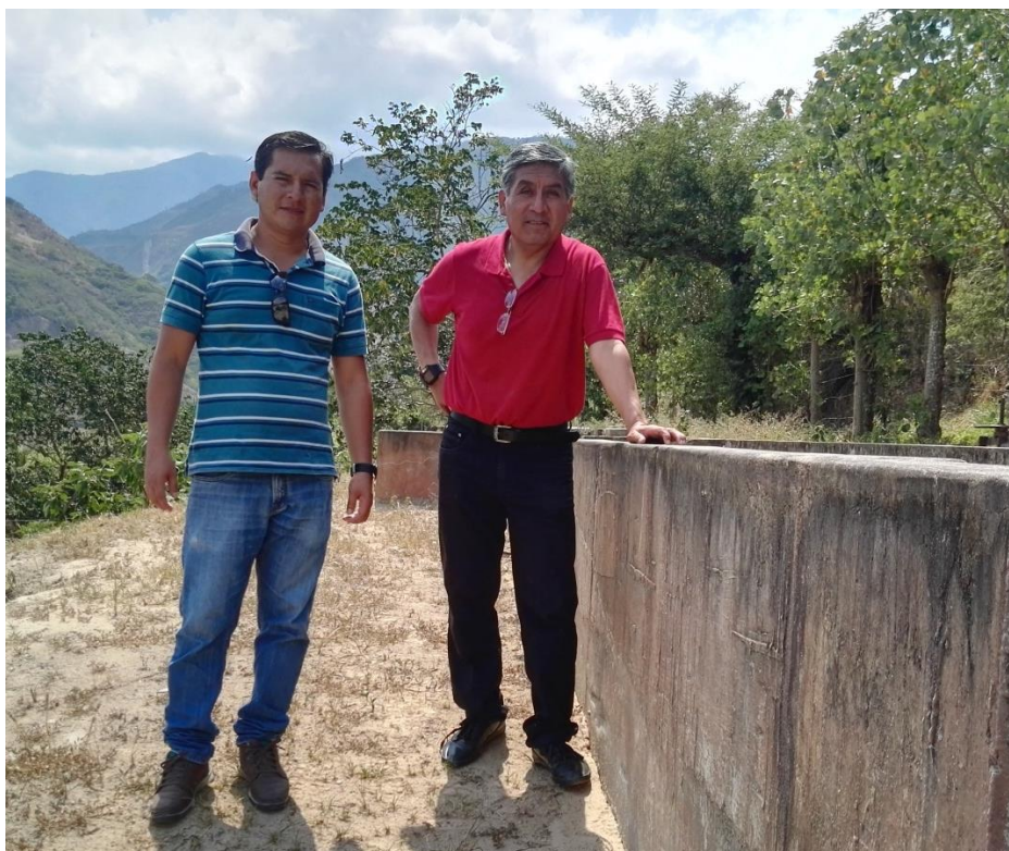
Foto Nº 09: Visita del asesor de tesis a la planta de tratamiento.