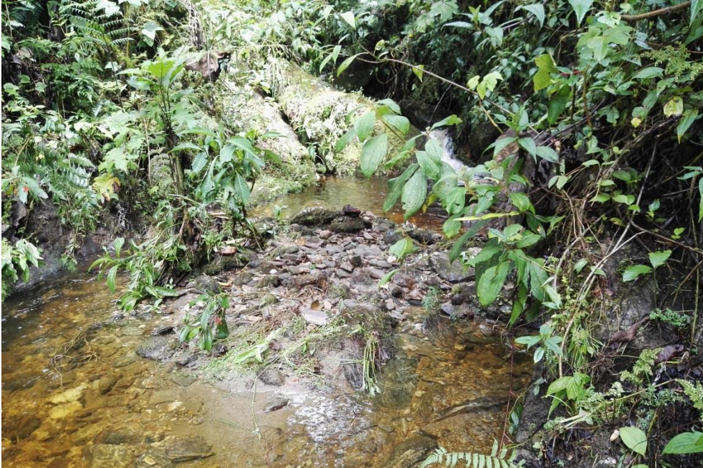
Foto N° 02: El lecho de la captación se encuentra saturada de material arrastrado por las aguas, tanto arena como piedras obstruyen el paso normal del agua.