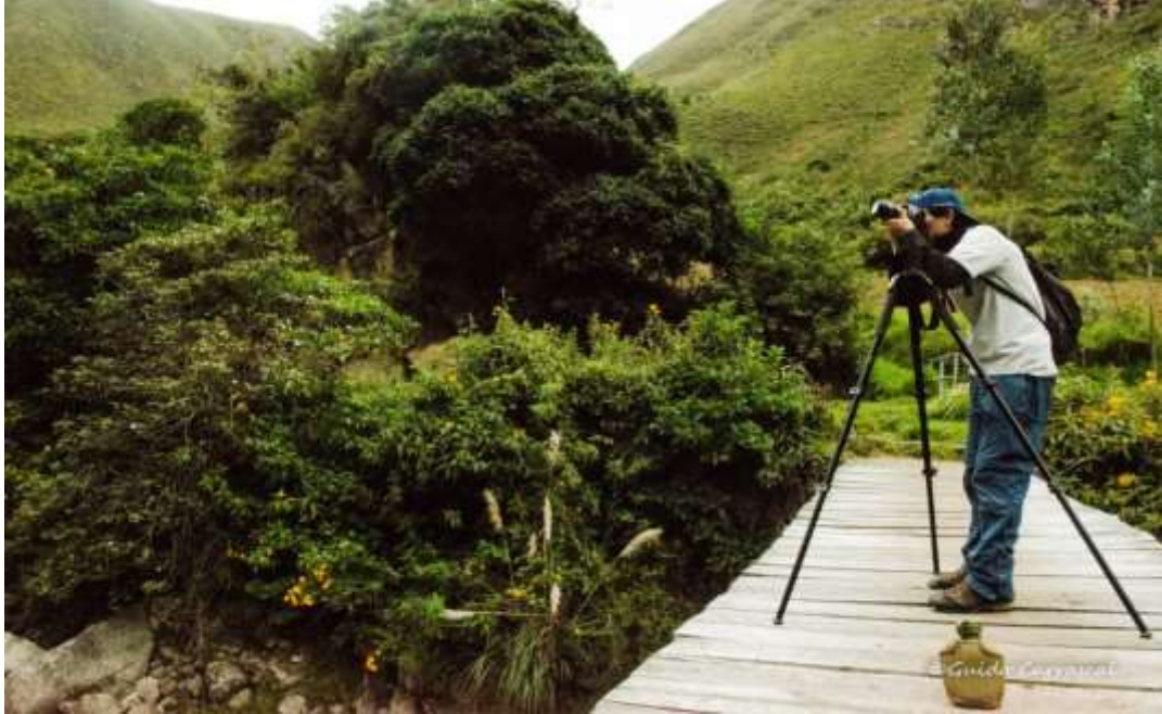
Figura 2: Observación del Taphrolebia griseiventris en el cañón de Sangal- El Chicche

Según la Unión Internacional para la Conservación de la Naturaleza (UICN), las áreas naturales protegidas son espacios continentales o marinos del territorio nacional reconocidos, establecidos y cautelados legalmente por el Estado. En el Perú están adscritas al Ministerio del Ambiente.