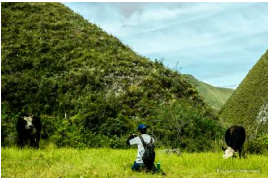
Figura 07 Ganadería