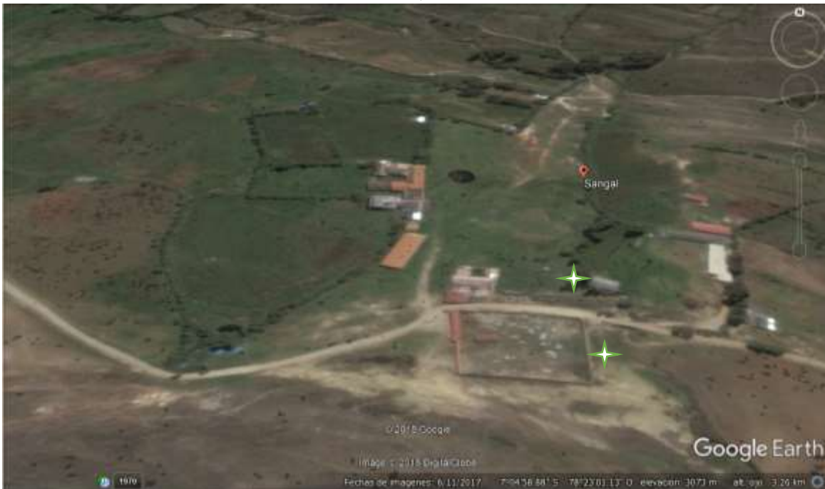
Figura 09 Ruta propuesta y puntos de observación

Además se acordará un pago por el uso de sus caminos y al final de cada caminata se acordará una despedida con algún representante de la comunidad para el compartir de experiencias y también sugerencias de parte de los visitantes. A continuación mostramos el mapa de la ruta de observación de aves propuestas: