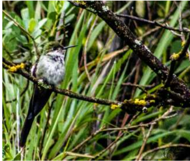
Figura 03. Taphrolesia griseiventris

La gorguera que está referido al cuello y pecho del macho es de color azul claro. El cometa ventrigrís es significativamente más grande; cola de color verde azulado o azul (no rojo bronceado); machos con gorgueras de diferentes colores, y hembra con menos pintas por debajo y sin blanco en vexilos exteriores de timoneras exteriores. ENDÉMICO (Schulenberg, 2010)