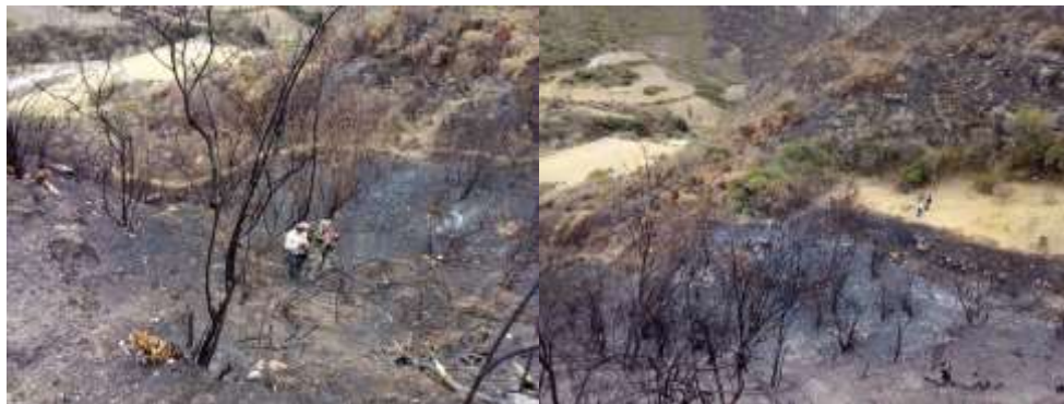
Figura 08: Quema de pastos y matorrales en zona de estudio.

El fuego, es el elemento natural más común de la naturaleza, por lo tanto el mal uso que se hace de él en el sector rural trae consecuencias devastadoras para el ser humano y para el medio ambiente, ya que una vez originado y salido de control, los costos económicos para la recuperación de las áreas afectadas son muy altos, y el tiempo que se requiere es largo.