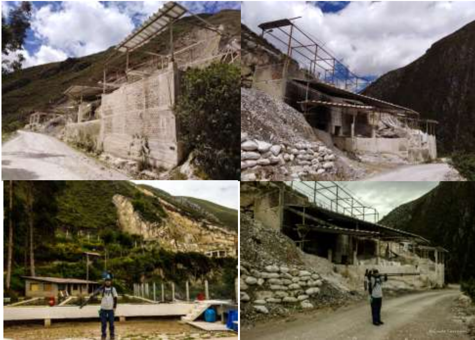
Figura 04. Calera “ARVAA 100”

Según datos de la Cámara de Producción y Comercio de Cajamarca al 24 de noviembre año 2015, existen 93 empresarios que se dedican a producir y/o comercializar cal en Cajamarca mostrando que existe gran potencial, sin embargo la gran mayoría son informales por tanto no están en condiciones de vender sus productos a quienes lo demandan pues hay una fuerte regulación por parte del Ministerio de Energía y Minas, SUNAT y la Policía Nacional del Perú, siendo requisito indispensable para comercializarla ser formal. Basados en los estudios de prospección inicial que se realizaron años atrás en el área de la Sociedad Minera de Responsabilidad Limitada ARVA “ARVAA 100” y considerando que el cañón de Sangal- El Chicche, en el distrito de Los Baños del Inca, es una zona minera por excelencia, indicador que se ha tomado en cuenta para investigar esta actividad extractiva.