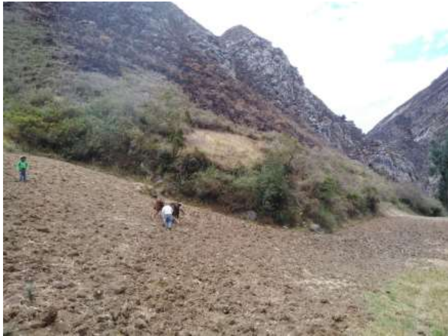
Figura 5. Parcela agrícola en el cañón de Sangal- El Chicche

La agricultura andina es extensiva, de baja productividad, debido a las condiciones en que son trabajadas las tierras. Nuestros agricultores andinos carecen de orientación técnica y científica. Está destinada al cultivo de productos alimenticios de “pan llevar” como la papa, las ocas, el trigo, el maíz, etc., usando herramientas agrícolas tradicionales como el arado con yunta, el pico, la pala, etc.