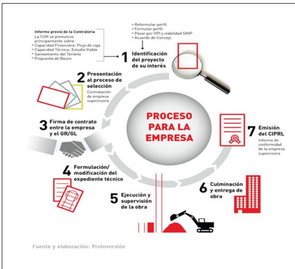
FIGURA 2: PROCESOS BASICOS DE Oxi PARA LA EMPRESA PRIVADA

La empresa identifica y financia un proyecto de su interés, de la lista de proyectos priorizados por los GR, GL o UP. La empresa podría presentar un proyecto nuevo. La entidad pública lo evalúa, lo declara viable en el marco de Invierte.pe y lo prioriza.