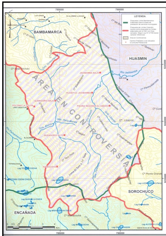
FIGURA 02. Ubicación geográfica

Nota: Sub Gerencia de Acondicionamiento Territorial del Gobierno Regional Cajamarca 2018