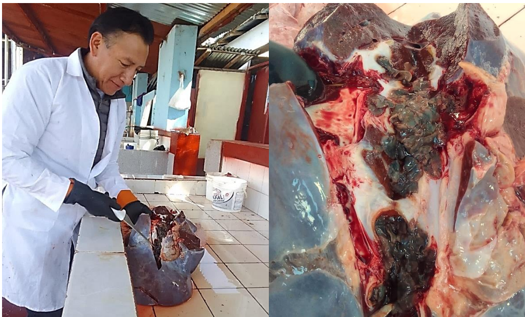
Figura 1. Izquierda. Cortes longitudinales sobre los conductos biliares, Derecha. Presencia de Fasciola hepatica adulta en los conductos biliares