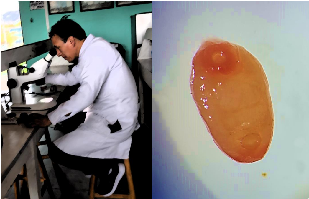
Figura 3. Izquierda. Observación en estereoscopio, Derecha. Se observa Calicophoron microbothrioides adultos (3X) con un cuerpo cónico y curvada ventralmente, de color rojizo (más intenso en los extremos anterior y posterior). Además, se observa un acetábulo muy desarrollado en la región posterior, a diferencia de la ventosa oral que se muestra estrecha en la parte anterior.