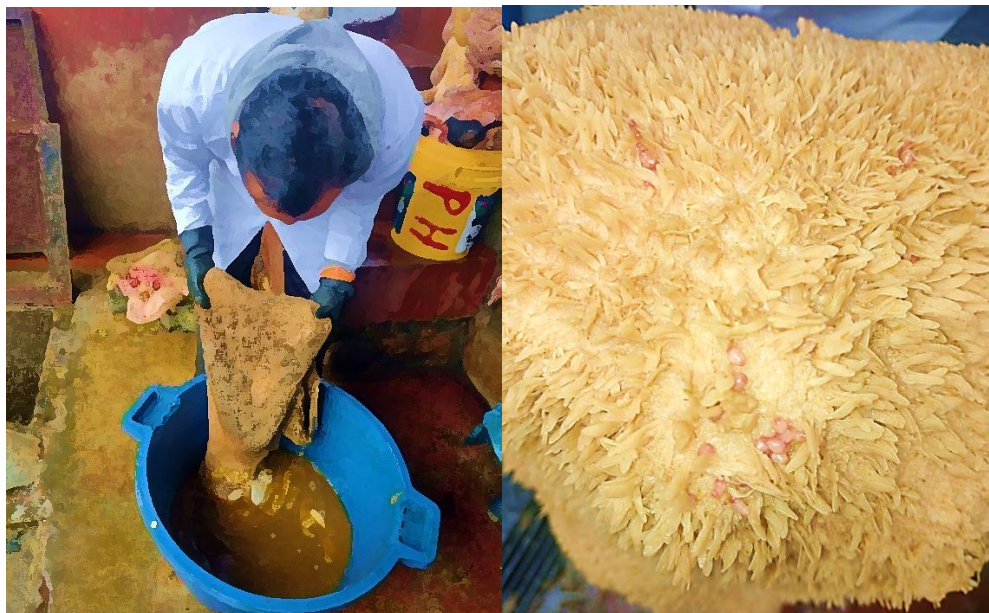
Figura 2. Izquierda. Lavado del rumen con agua corriente, Derecha. Presencia de Calicophoron microbothrioides adultos adheridos a la pared del rumen.