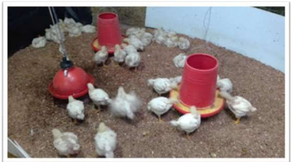
POLLOS EN VIRUTA