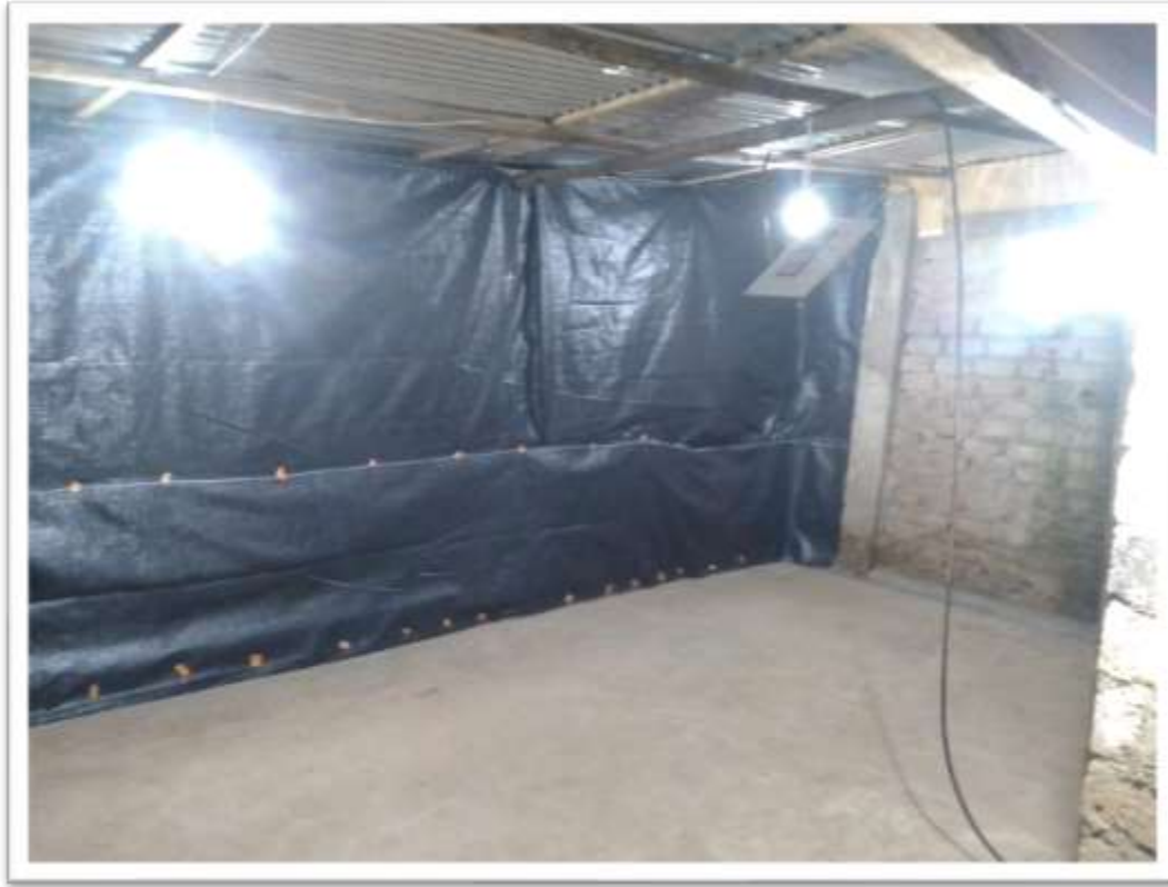
PREPARACION DE GALPON