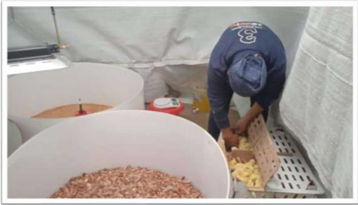
RECEPCION DE POLLOS BB