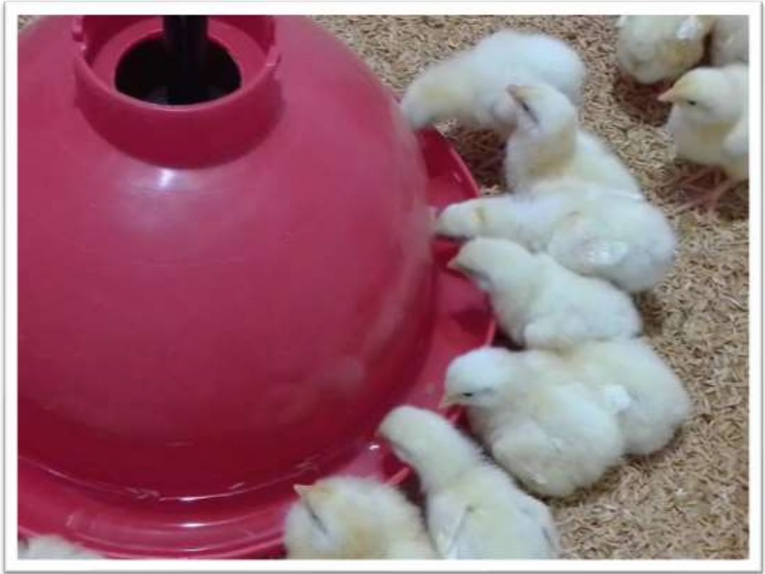
POLLITOS TOMANDO AGUA