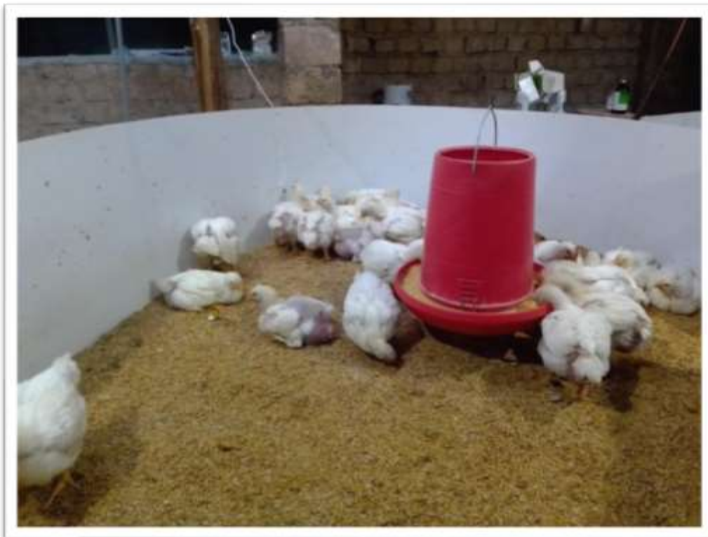
ACABADO EN CASCARILLA DE ARROZ