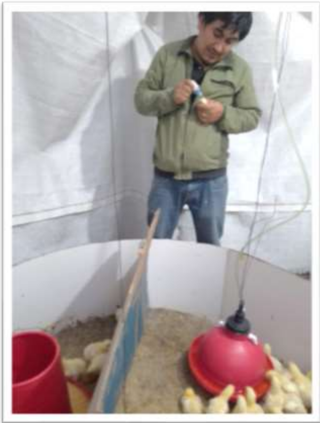
VACUNACION DE POLLOS