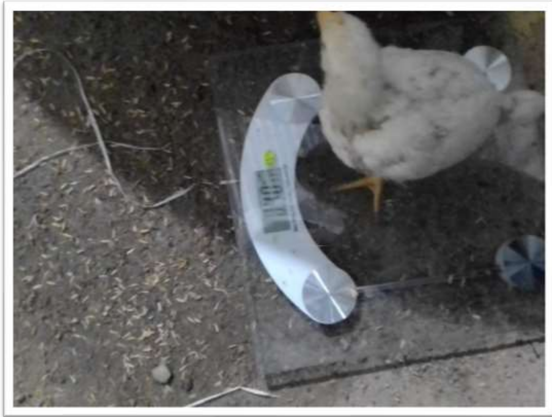
PESAJE DE POLLITOS