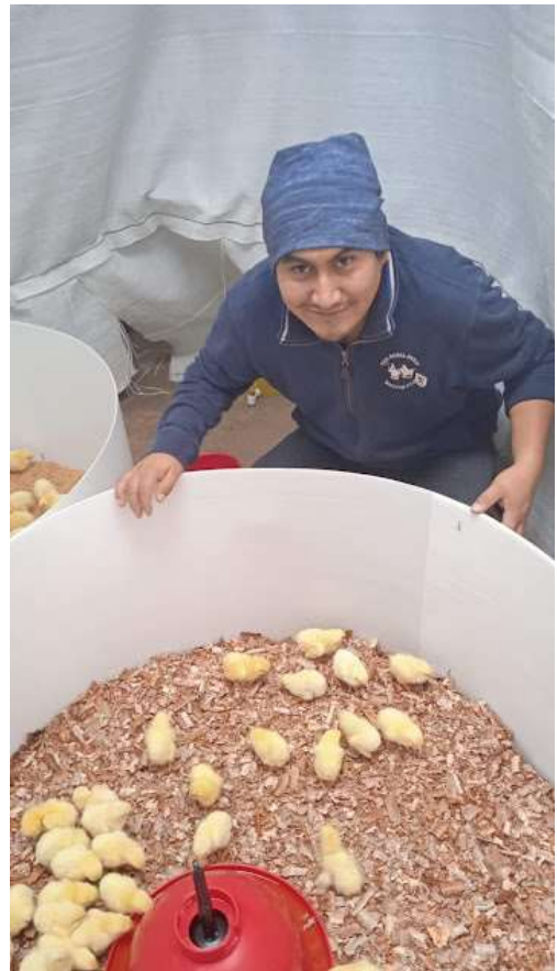
POLLOS EN VIRUTA