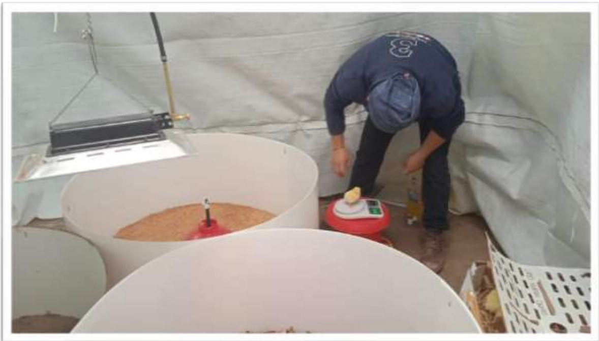
TOMA DE PESO INICIAL