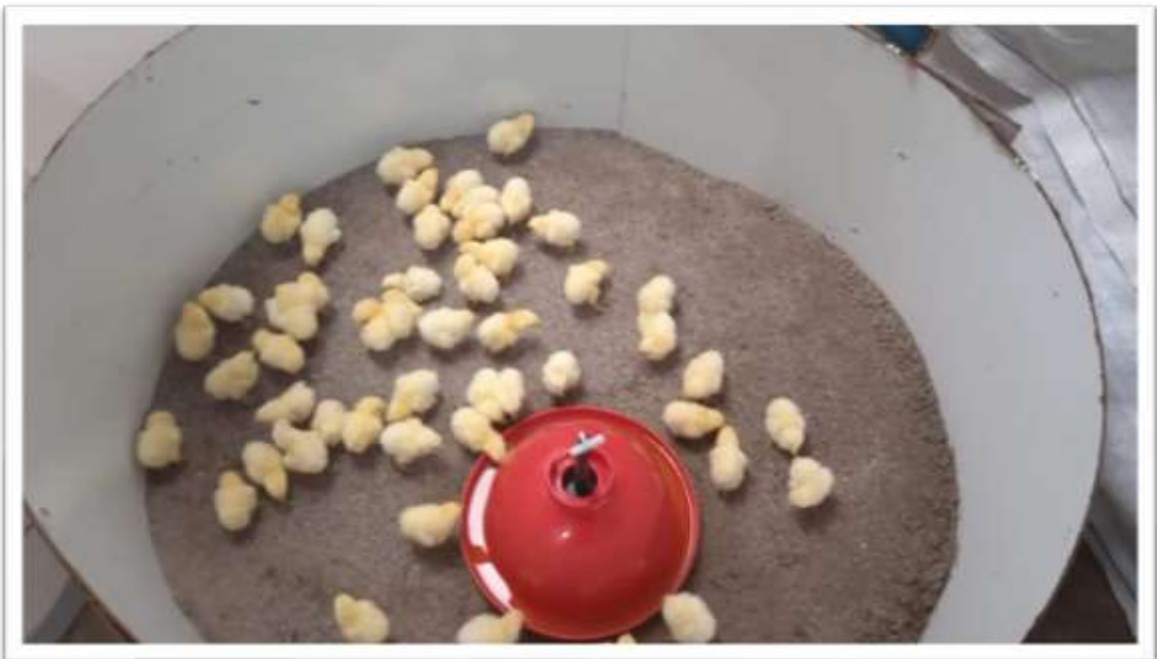
POLLOS BB EN TRATAMIENTO EN ARENA