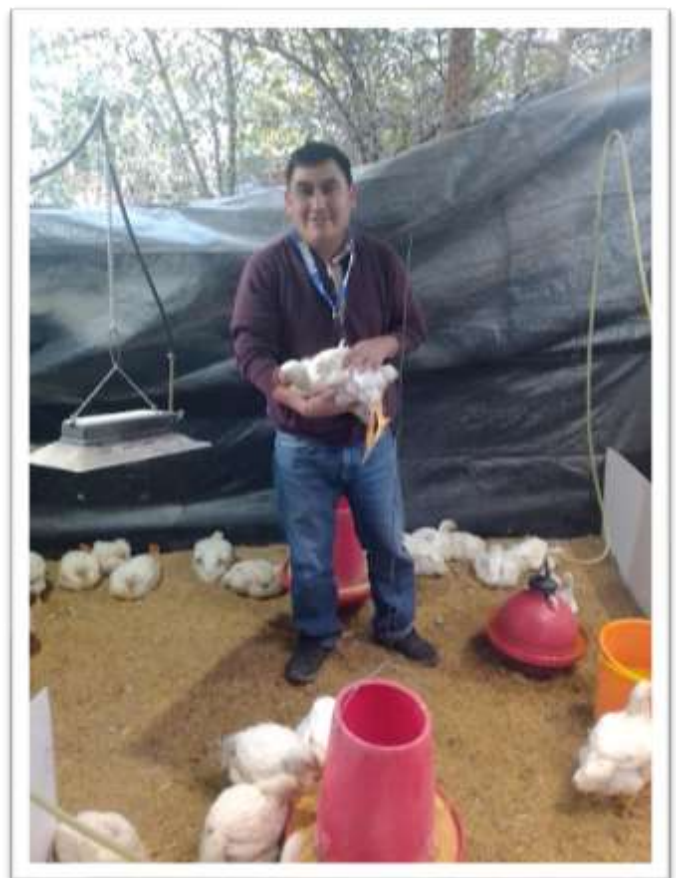
ETAPA DE ACABADO