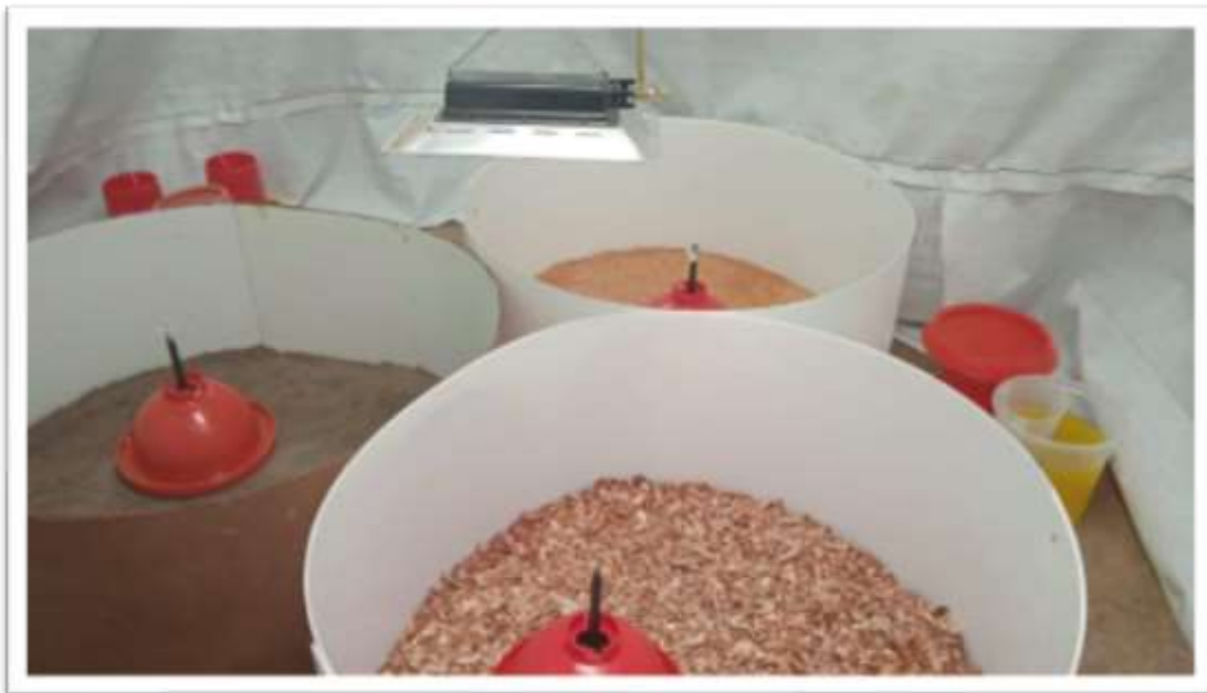
ACONDICIONAMIENTO PARA CADA TRATAMIENTO