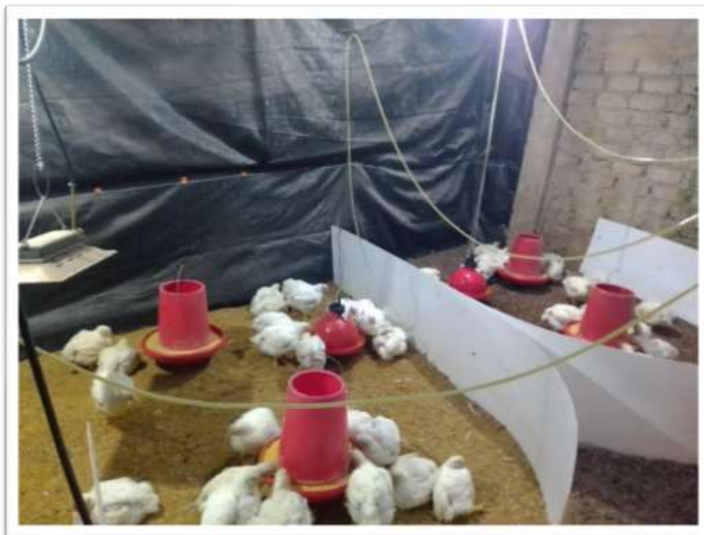
VISTA PARONAMICA DE LA CRIANZA