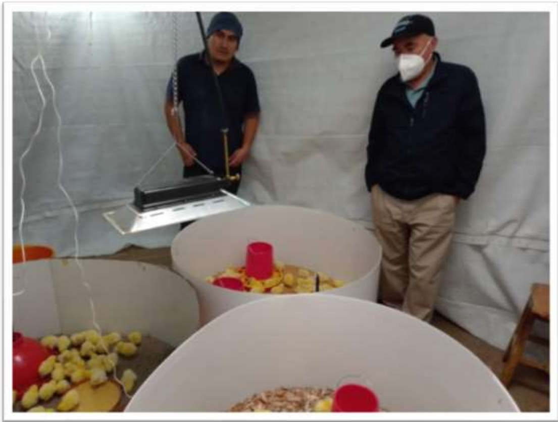
VISITA DE ASESOR