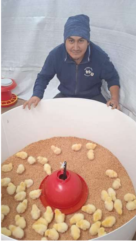
POLLOS BB EN CASCARILLA DE ARROZ