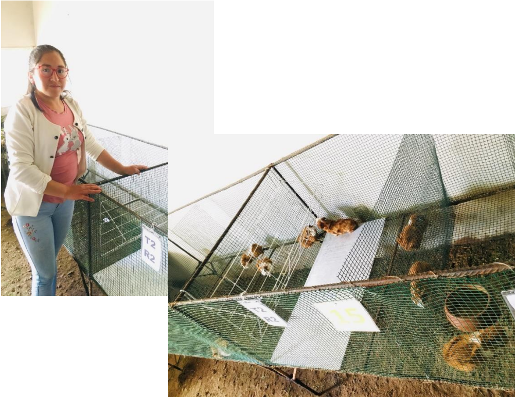
Foto 3 Formación de lotes de los cuyes en tratamientos para inicio del experimento