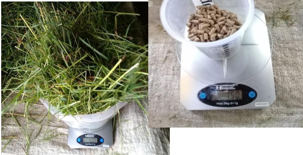
Foto 4 Pesado del alimento diario proporcionado a los cuyes