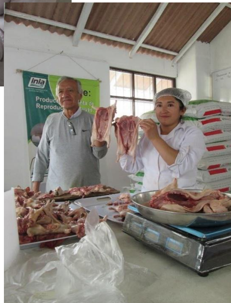
Foto 8. Beneficio de los cuyes según tratamiento y repetición