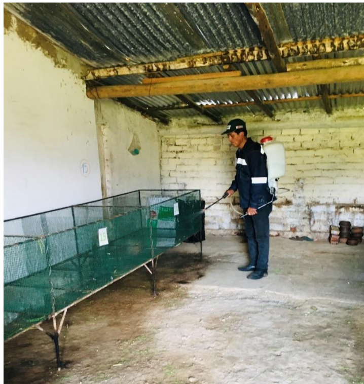
Foto 2 Desinfección de instalaciones e implementos