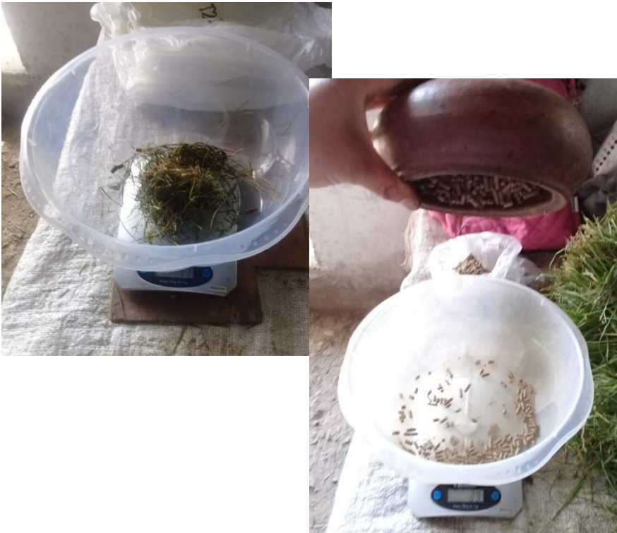
Foto 5 Pesado del residuo del alimento diario proporcionado a los cuyes