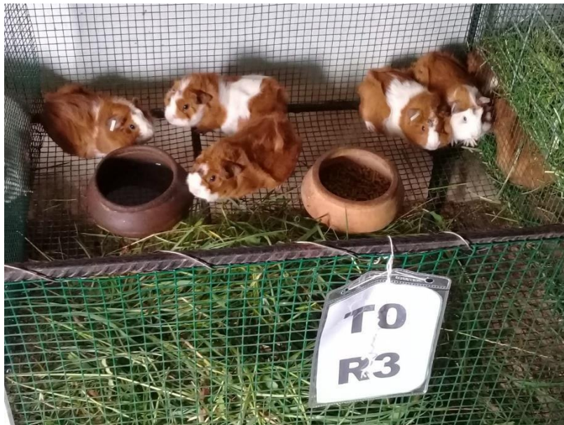
Foto 6 Alimentación de los cuyes según tratamiento y repetición