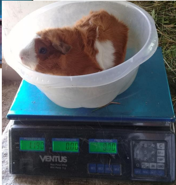
Foto 7 Control de peso de los cuyes según tratamiento y repetición