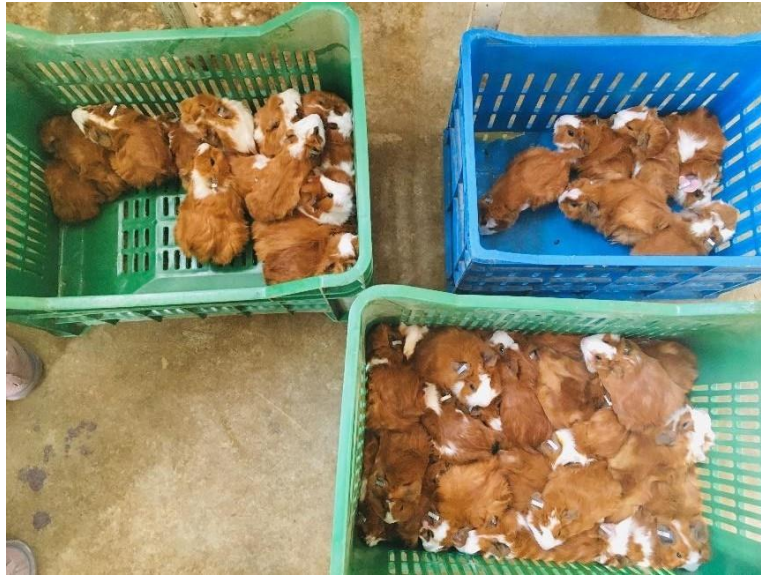
Foto 1 Selección de cuyes para el experimento