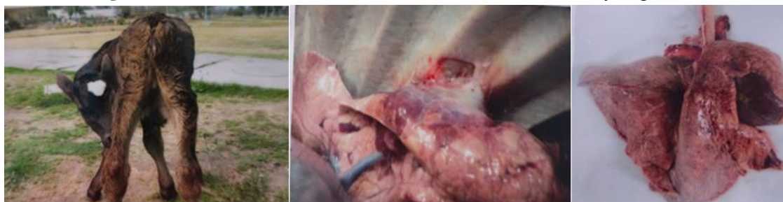
Figura 3: Ternera con diferentes malformaciones físicas y orgánicas

A. Presencia de anuro. B. Adherencia de lóbulo izquierdo del pulmón hacia la pleura costal a la altura de la 4. a y 5. a costilla. C. Zonas de coloración rojizas a marrón oscuro, especialmente en el lóbulo derecho, común en casos de neumonía.